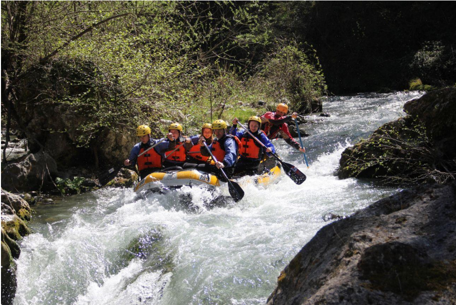
Mardi 2 Avril: Travail de groupe- échange pédagogique