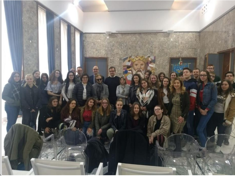
Mercredi 3 Avril: Visite du Chateau de S.Severina