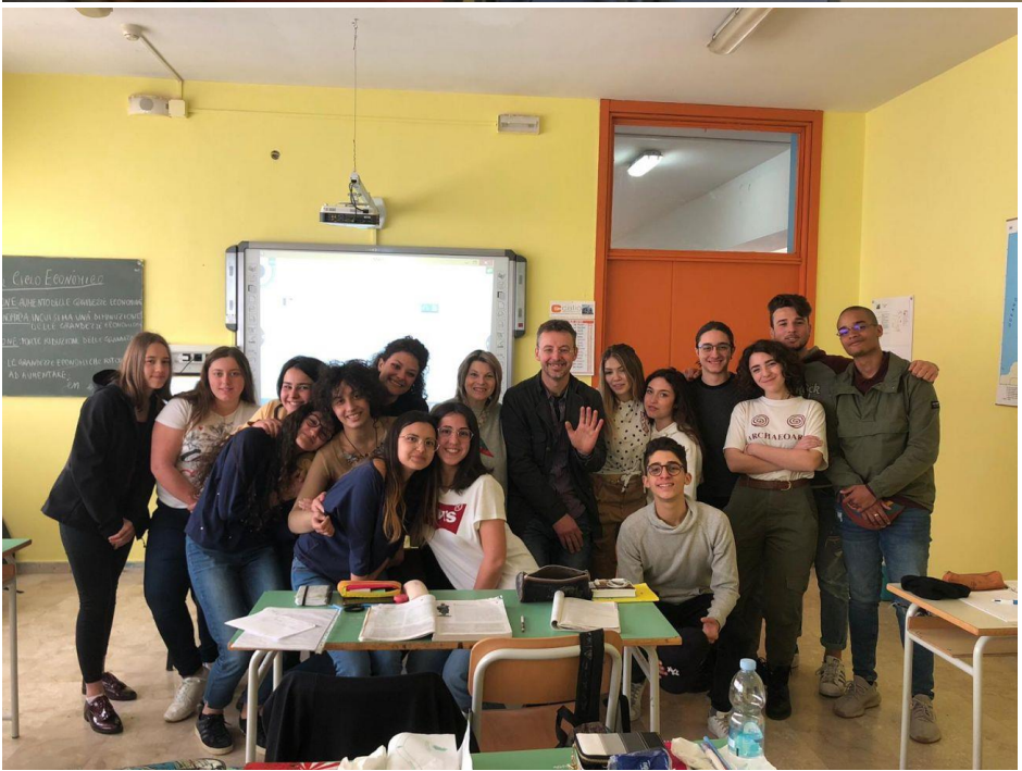
Visite de la Ville