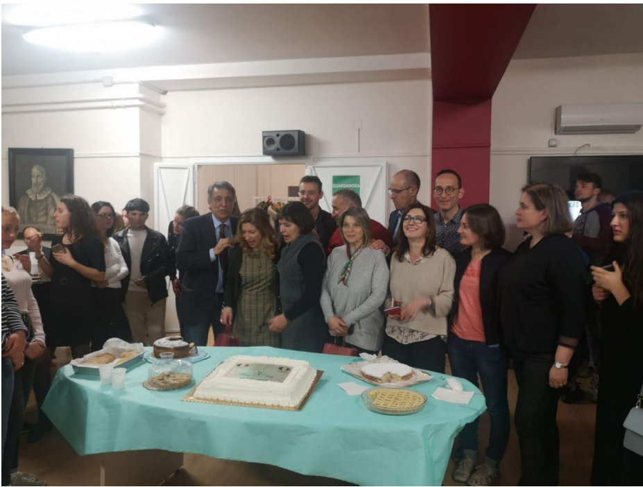
Vendredi 5 Avril: Salutations-“Au revoir à bientôt”