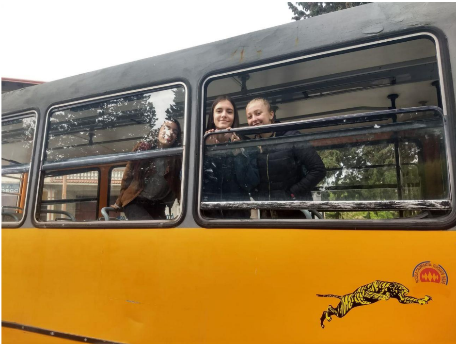
Vsiste à Le Castella-Isola Caporizzuto