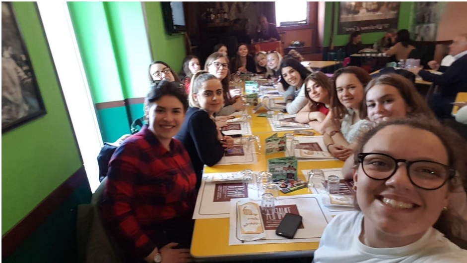
Jeudi 4 Avril: Soirée de socialisation entre les élèves, les familles, les enseignants et les autorités.