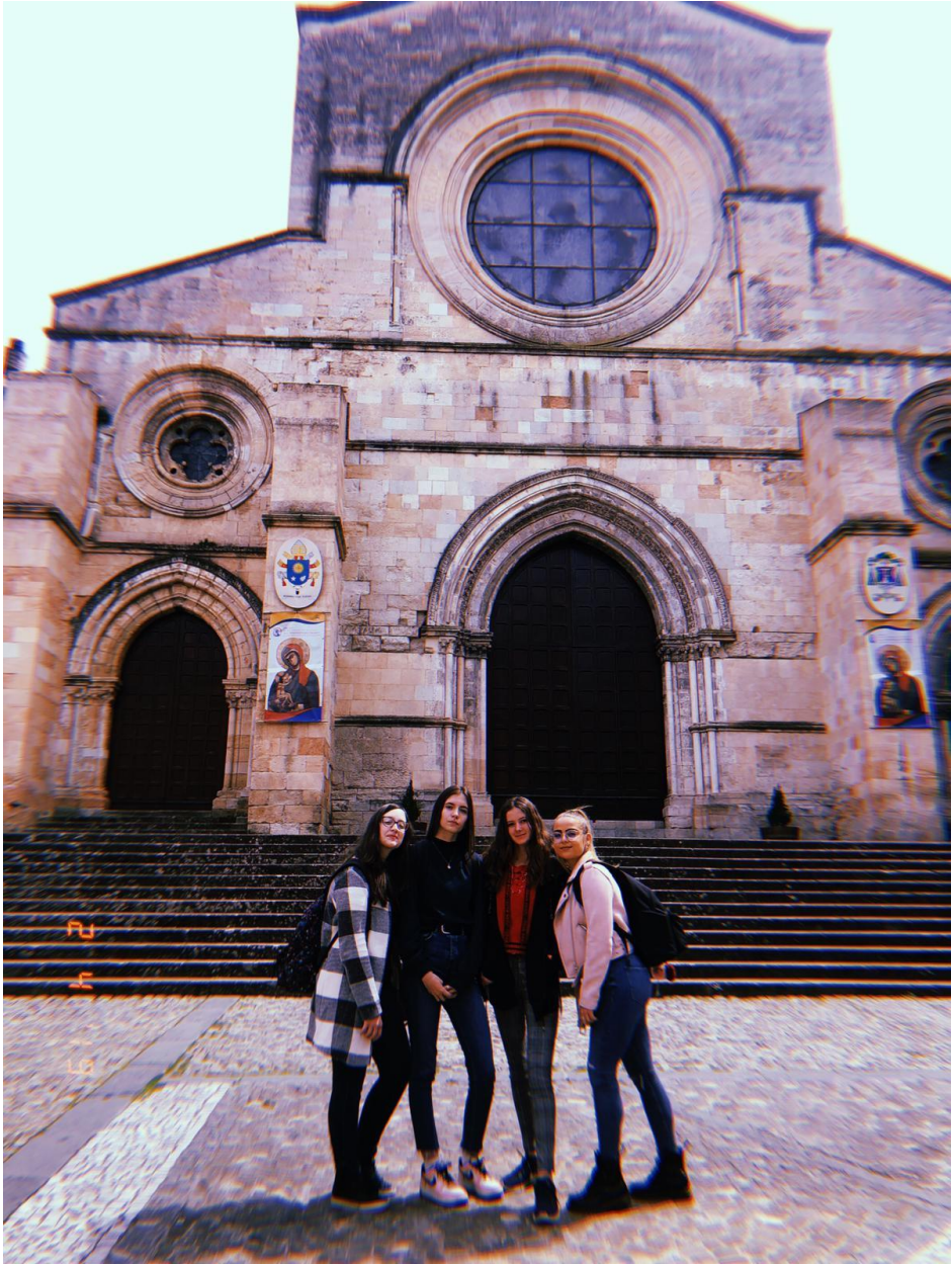
Rencontre avec les autorités municipales de Cosenza