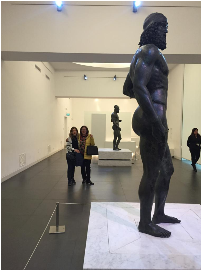
Lundi 1 Avril: Rafting