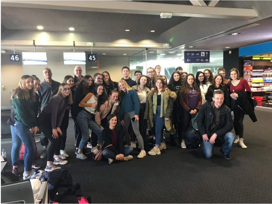
Samedi 30 Mars: Accueil officiel.