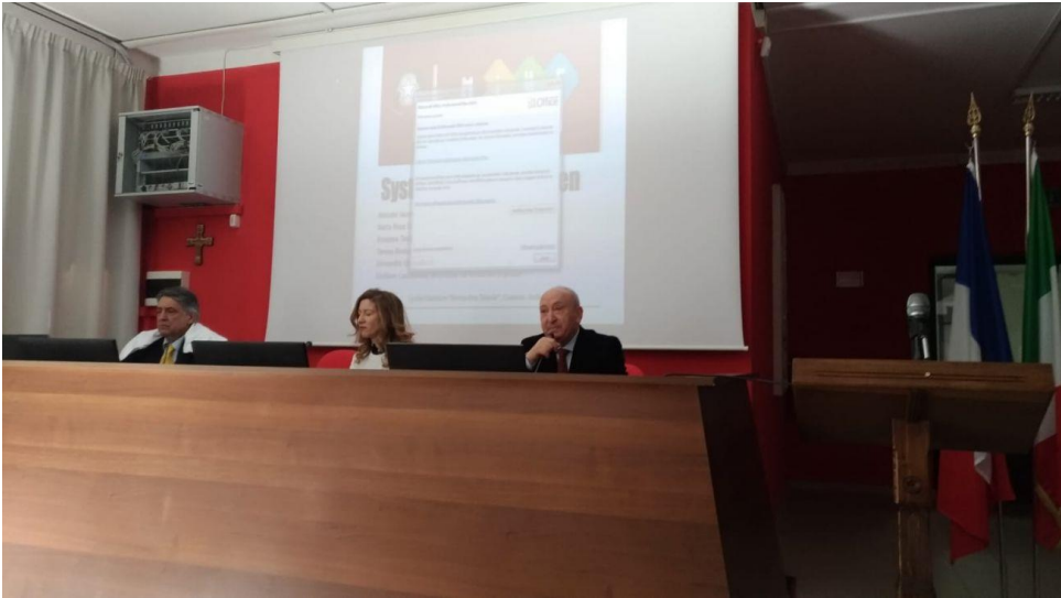
Seminaire_débat sur les migrants.