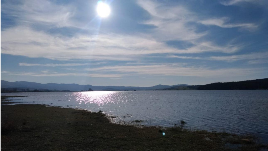
Dimanche 31 Mars: Visite à Monte S.Elia.